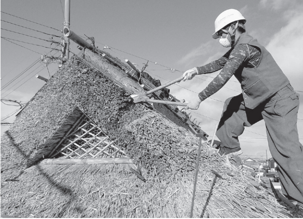
入母屋根 妻の刈り込み