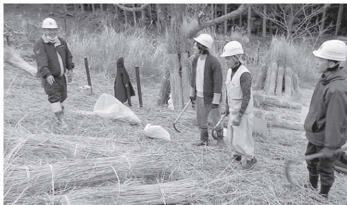
刈り取られた茅を前に