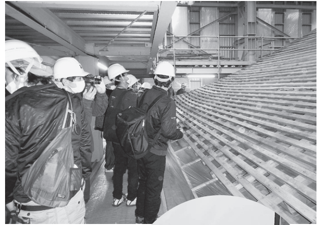
興味深く眺める参加者

今年もこのような研修会を行うことができ、現場を提供いただいた延暦寺様、滋賀県文化スポーツ課、元請け各業者の皆様、関係者の皆様に心より御礼申し上げます。ありがとうございました。