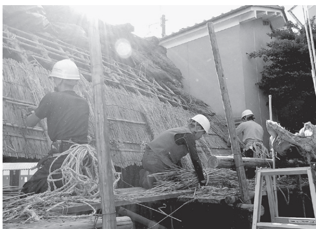
熱心に取り組む研修生たち

本年度も昨年同様、コロナ禍での活動となり様々な配慮が必要でしたが、葺き替え研修2回、茅刈り研修1回をそれぞれ行うことができましたこと、各関係者の皆様にこの場を借りて御礼申し上げます。