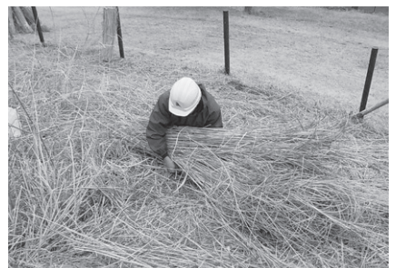
ある程度の量になったら紐で束ねる