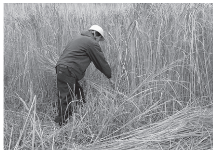
茅を抱え鎌で切る