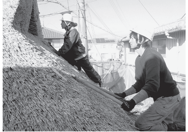
表面を揃える刈り込み