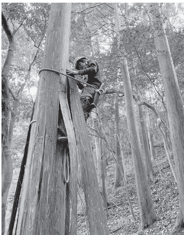
バランスをとりながらへら入れ

日程変更など迅速に対応くださった国有林管理署の皆様、吉川八幡宮の皆様、採取事業に関わるすべての皆様に感謝申し上げます。今後ともご理解とご協力をお願いいたします。