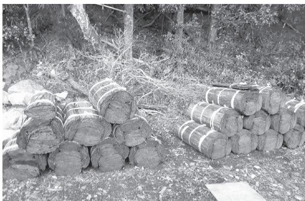
1丸単位に再結束された丸皮