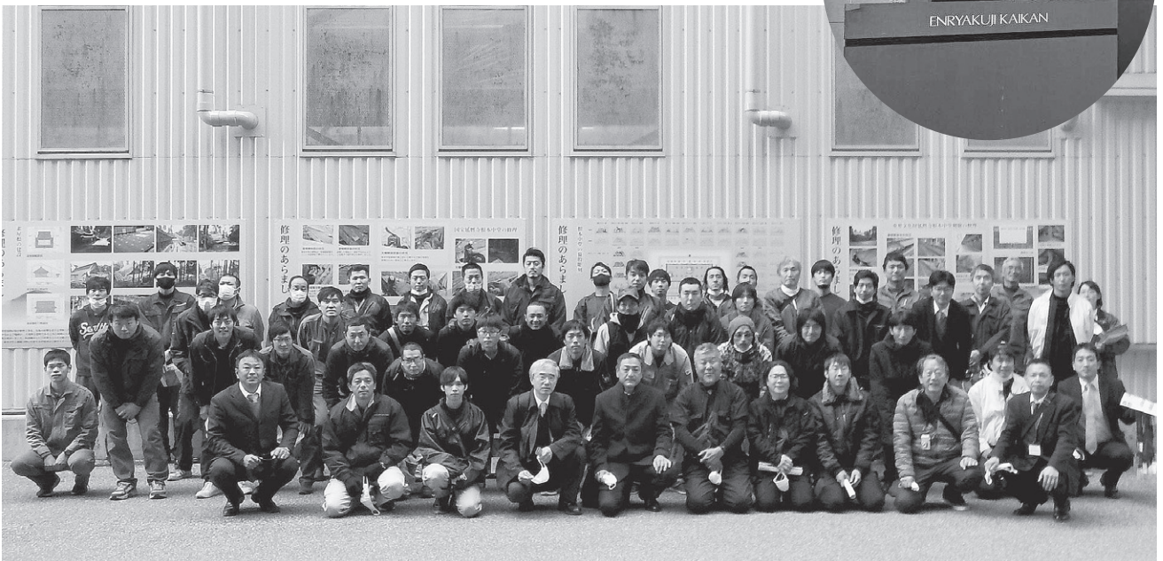
工事現場前に集合