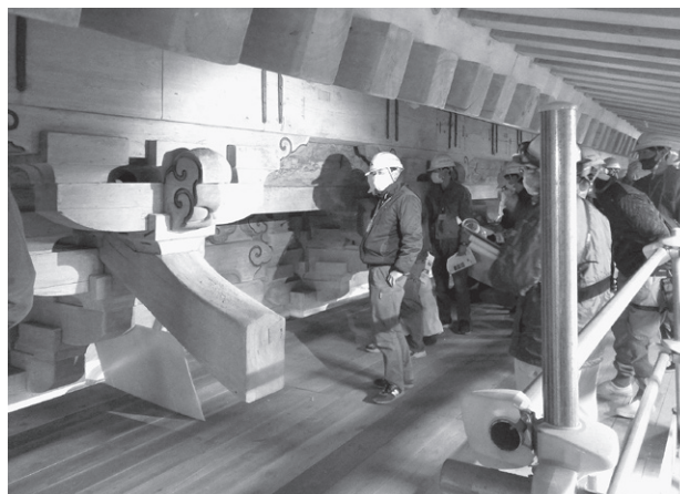
延暦寺 根本中堂 募股彫刻

日 時 ● 令和3年12月3日(金) 13:00～16:00 会 場 ● 延暦寺 国宝 根本中堂 大改修工事現場、 延暦寺会館 (滋賀県大津市坂本本町 4220)