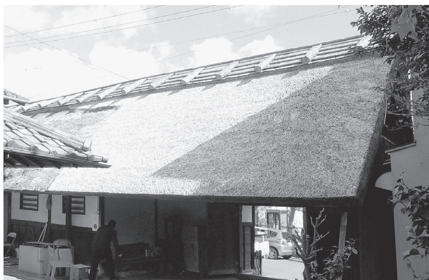
完成した奥溪家住宅 長屋門