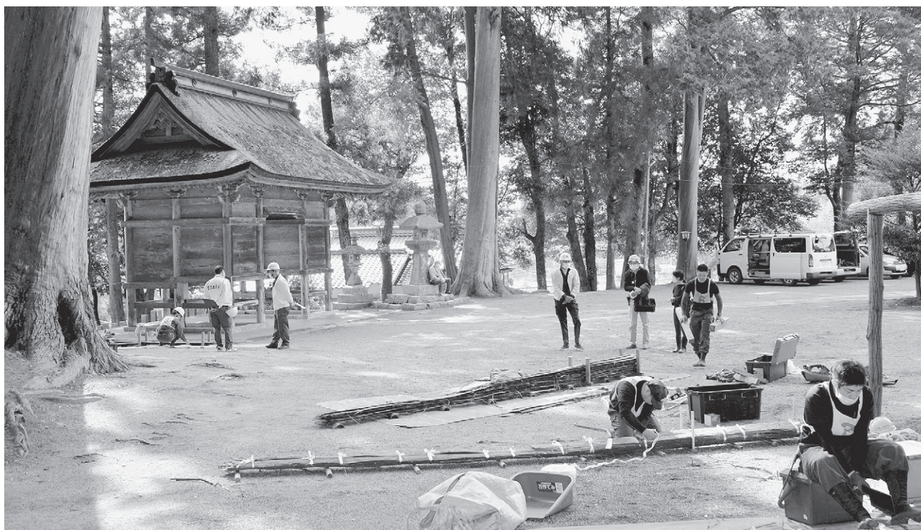
檜皮の結束や切断をする研修生