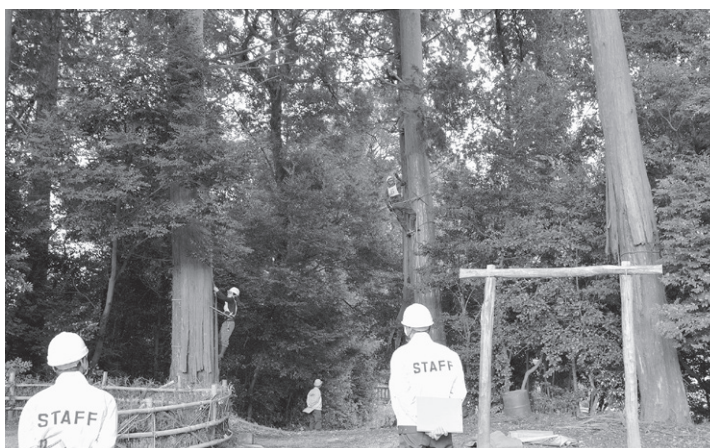
技術を見極める査定員