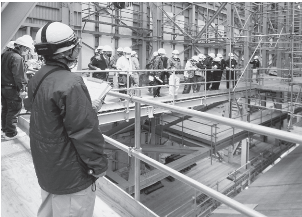
屋根の高さから見学する参加者