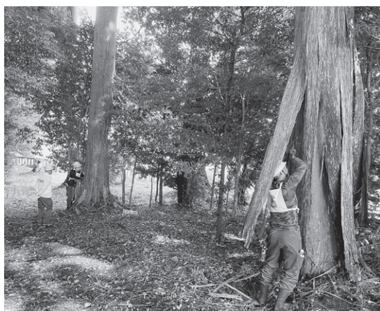
ヘラを使って慎重に作業する研修生

最後に、今回査定会の開催にご協力いただきました吉川八幡宮の皆様に心より感謝申し上げます。