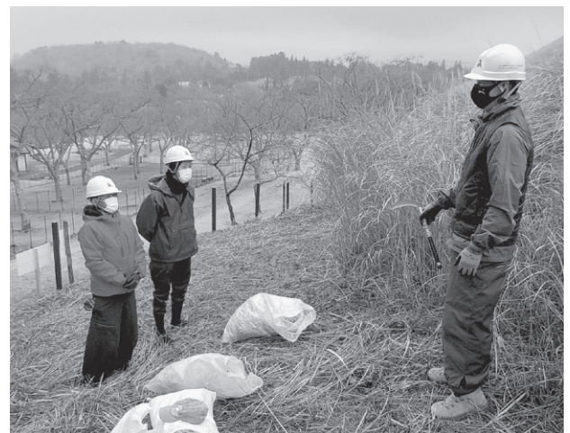
大室山 指導員と研修生

今回の茅刈り研修を終えて、普段何気なく使っていた茅の有り難みに改めて気付かされました。1日約8時間山に入って茅を刈り、収穫できる茅の量は30～40束程度。一つの現場に使う茅の量から比べると到底足りなく、一体どれほどの人が何日かけて用意してくれた茅なのか…。今までも大切に使っているつもりではいましたが、この研修を終えて自分が実際に体験し、その苦労を体感したことによって、より一層茅の一本も無下にすることはできないなと思いました。一流の茅葺き職人になるためには技術もさることながら、茅に対するそういったような思いも必要なのではないかと思いました。これからもこの茅刈り研修を続けて広がっていけばいいなと思いました。