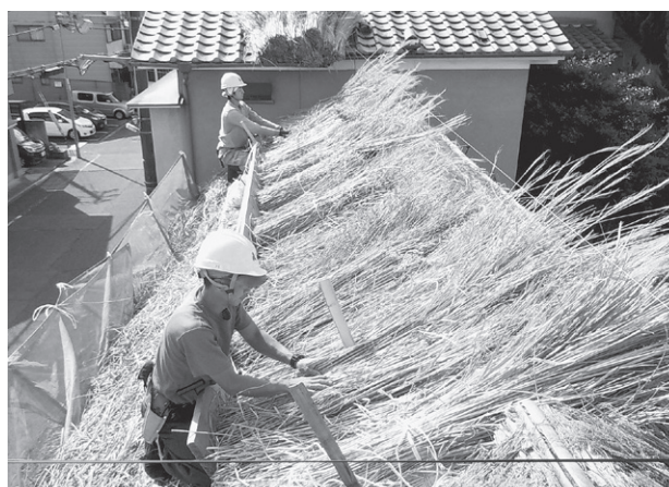
新たな茅を葺き上げる