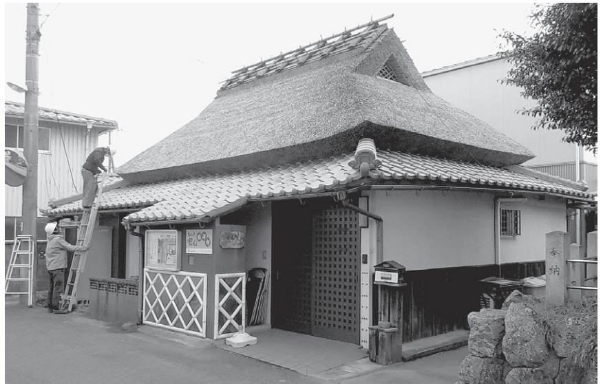
完成した NPO 法人宅老所「心」